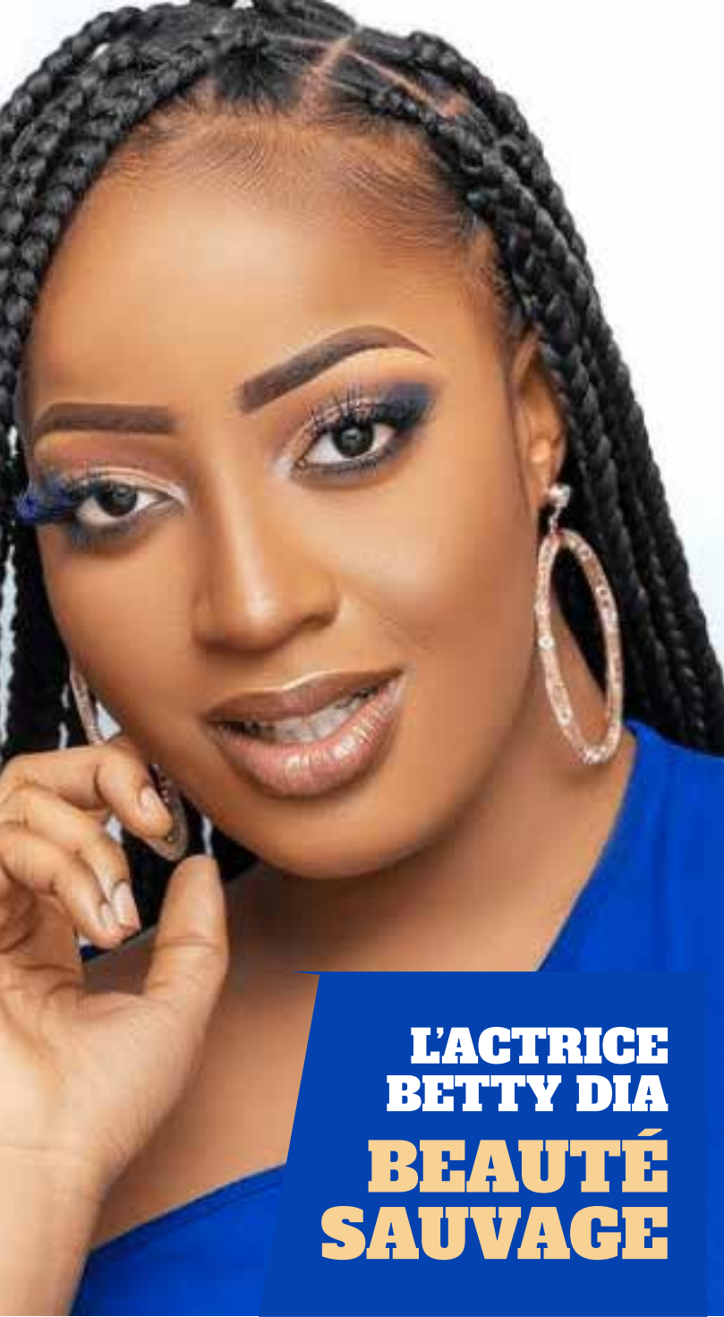
L'ACTRICE BETTY DIA BEAUTÉ SAUVAGE